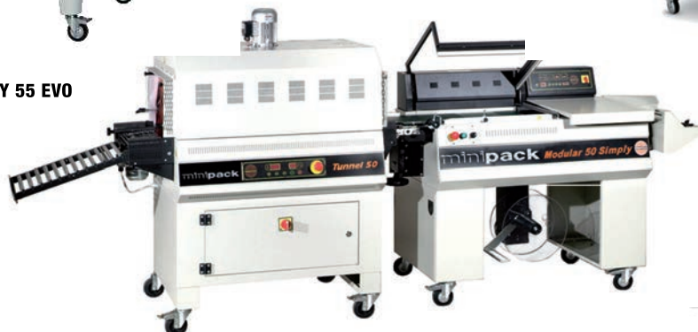
MODULAR 50S + TUNEL