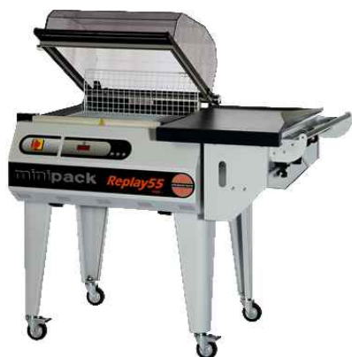
REPLAY 55 EVO

Gama completa de máquinas de retráctil y embolsadoras desde manual a completamente automática en línea.