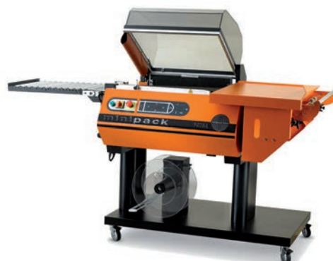
MINIPACK FC 76A