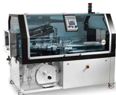
PRATIKA 56 MPE