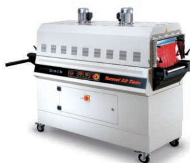
TUNEL MODULAR TWIN